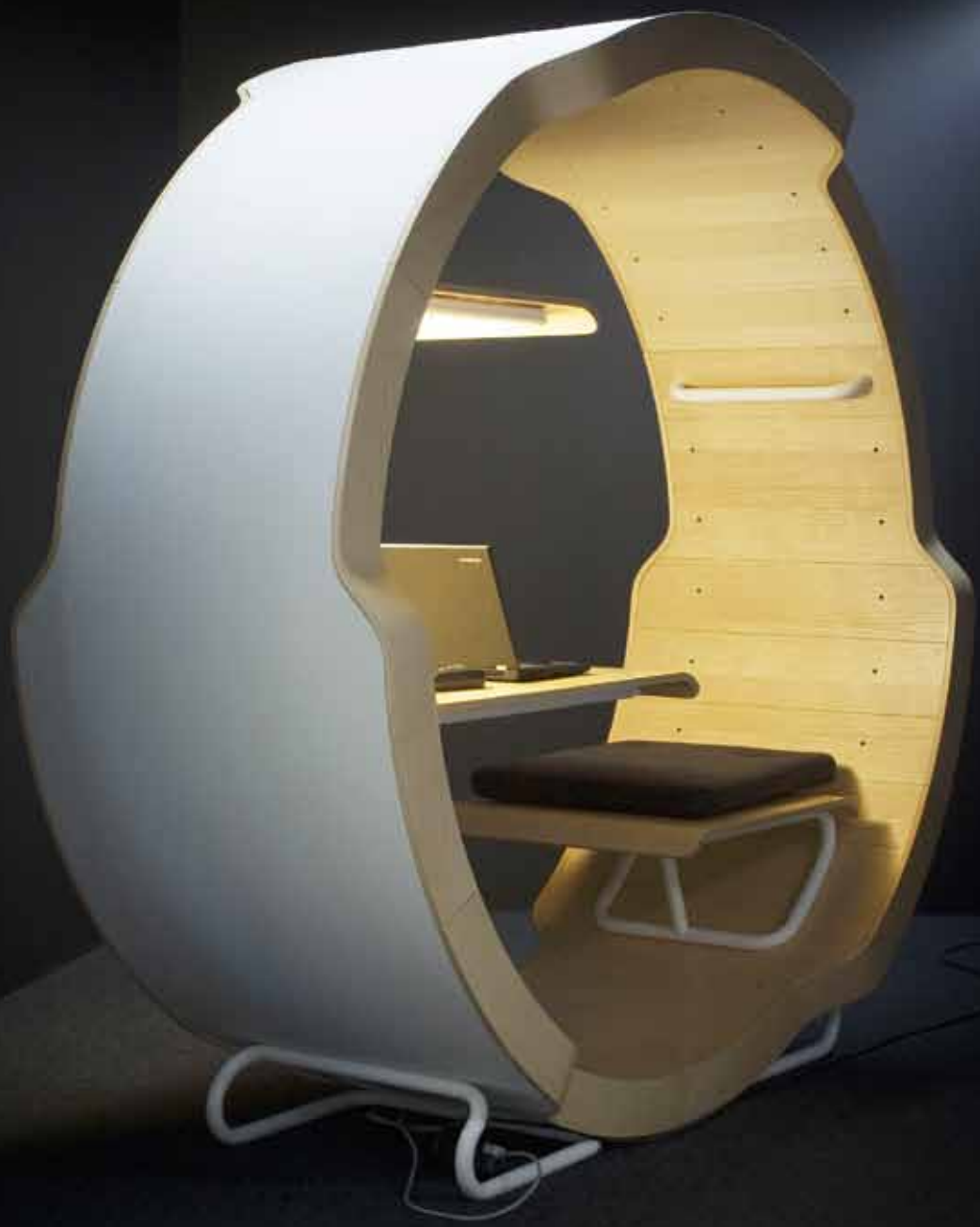
Allt i ett. Kontorsmöbler med fräck design och integrerad teknik är EFGs specialitet.